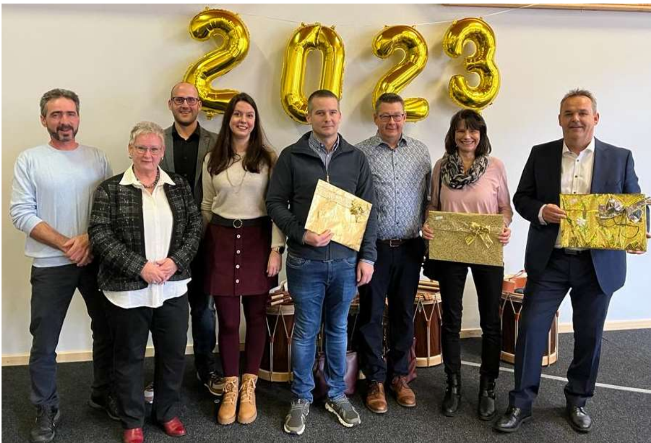
Der Gemeinderat mit den Geehrten